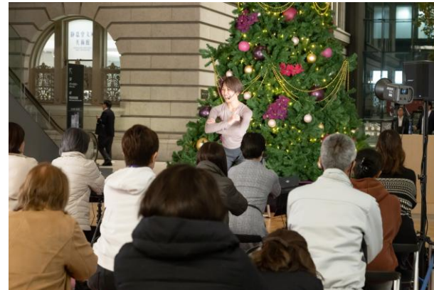
手軽に続ける。 からだを整えるストレッチ