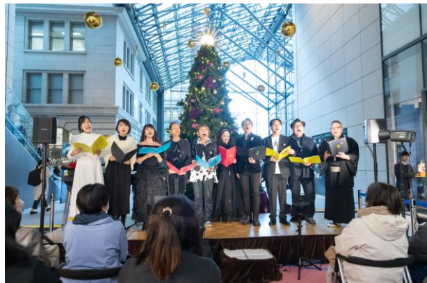
山田邦子さん率いるスター混声合唱団 による、コンサート～歌とトーク～