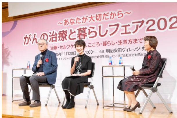
①あなたには明日生きる意味がある ~あなたが大切だから~