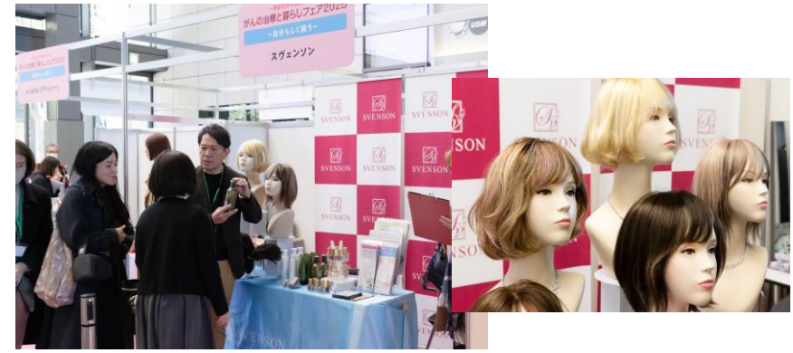
株式会社スヴェンソン