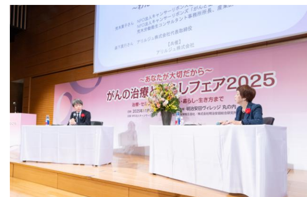
⑥がん治療と仕事の両立 ~わたしたちができること~