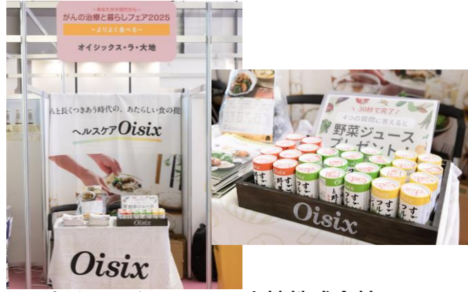
オイシックス・ラ・大地株式会社