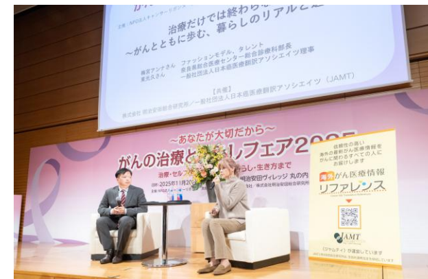
③治療だけでは終わらない ~がんとともに歩む、暮らしのリアル と選択~