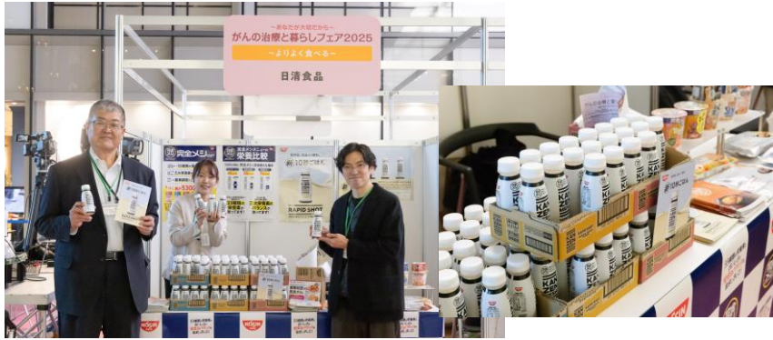
日清食品株式会社