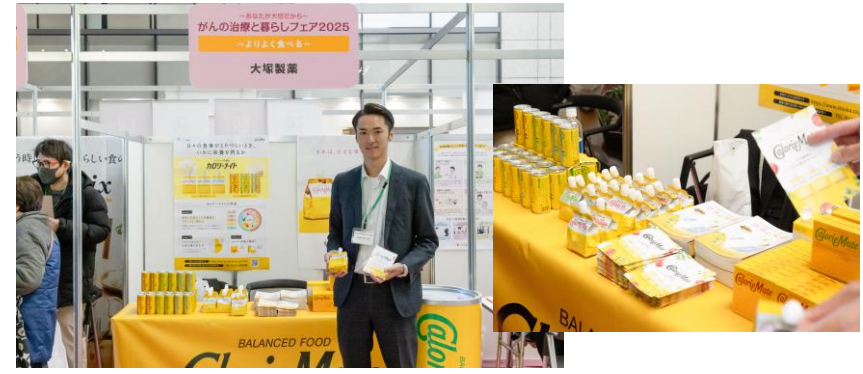
大塚製薬株式会社