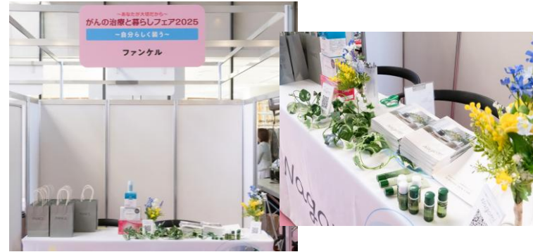
株式会社ファンケル