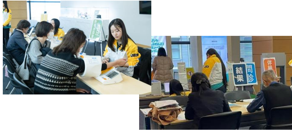
QOL健診(明治安田×弘前大学)