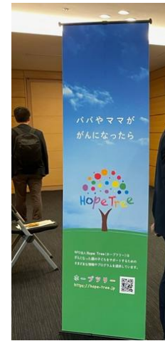
NPO法人ホープツリー