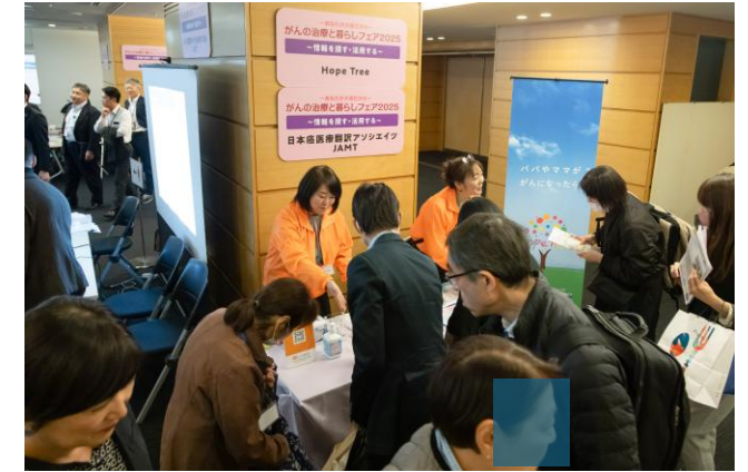
一般社団法人日本癌医療翻訳アソシエイツ (JAMT)