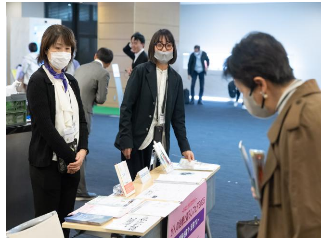
NPO法人キャンサーリボンズ