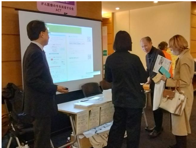
一般社団法人日がん医療の今を共有する会 (ACT)