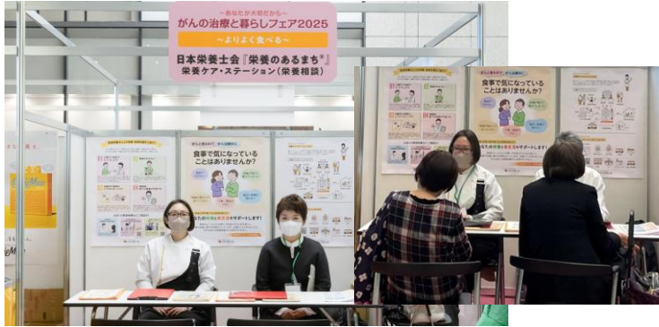
日本栄養士会 栄養ケア・ステーション® (栄養のあるまち®)