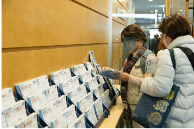
生活の工夫カード