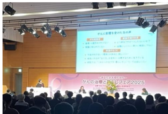
⑤あなたは何を大切にしたいですか？ 共に考えたい、これからの生き方・暮らし方