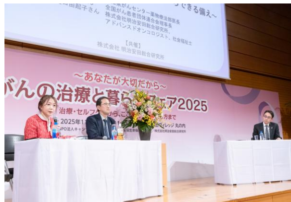
②今、知っておきたい「がんの経済毒性」 ~医療費の仕組みはどう変わる？ 今からできる備え~