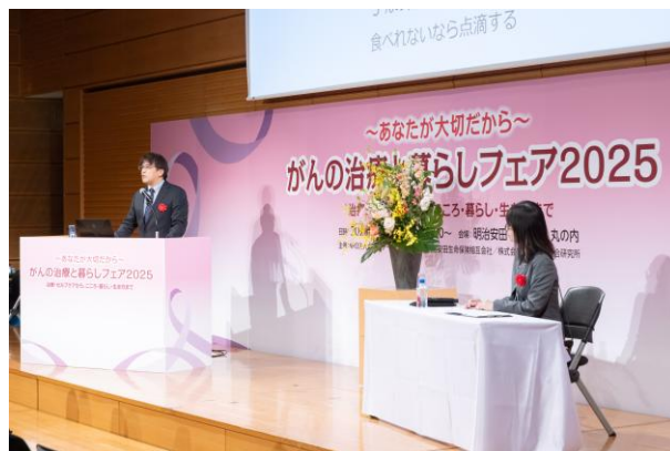
④がんを治療する人に知ってほしい。 栄養・食の考え方&実践法