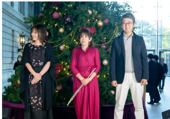
ヘアメイク&ファッションショー